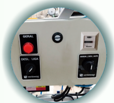
Painel com horímetro