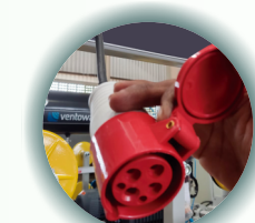
Conector com trava